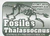
Matasellos de Primer Día de Emisión